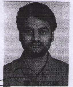
समाज कल्याण एवं अनुसंधान समिति कोटा (राज.) 324001