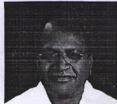
समाज कल्याण एवं अनुसंधान समिति कोटा (राज.)